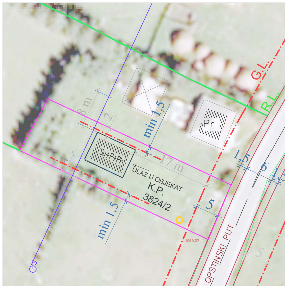
URBANISTIČKA REGULACIJA I PARCELACIJA za zone za koje nije predviđena dalja planska razrada